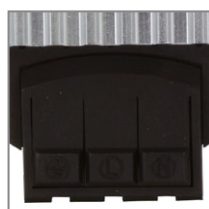
Быстрое подключение через клеммы

Обогреватель на DIN-рейку клеммный IP20 EKF предназначен для обогрева электрооборудования в электротехнических шкафах. Предотвращает образование конденсата, появление коррозии и падение температуры ниже минимального значения. Защищает от замерзания электронные компоненты. Предназначен для длительного режима работы. Конструкция алюминиевого профиля обеспечивает естественную конвекцию воздуха, благодаря чему достигается равномерное распределение температуры. Подключение через клеммы ускоряет процесс монтажа.