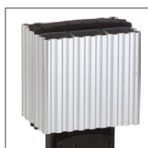
Легкий корпус из анодированного алюминия