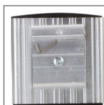
Установка на DIN-рейку